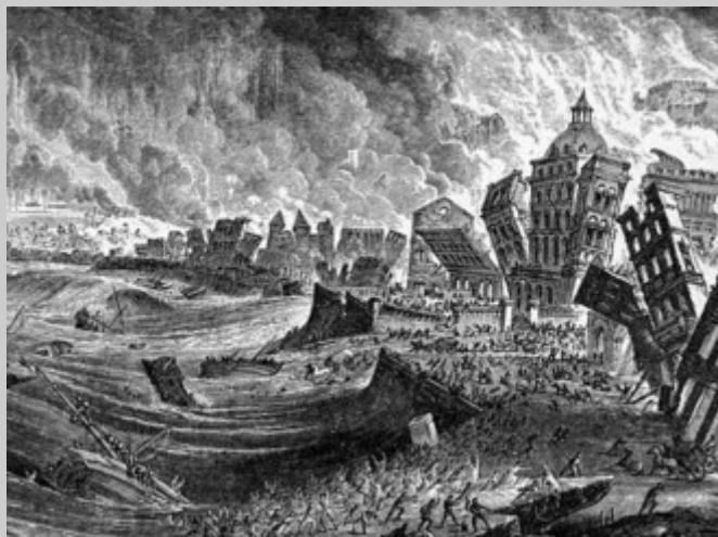
Fonte: Hartwig, Georg Ludwig. Volcanoes and Earthquakes: A popular Description in the Movements in the Earth's Crust, from 'The subterranean world' . Londres, 1887.

Não é recomendável o desenvolvimento de equipas CERT de forma totalmente independente ou fechada. As CERT servem as comunidades devendo por isso fazer parte delas.